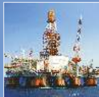
Oil & Gas