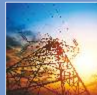
Energy & Power