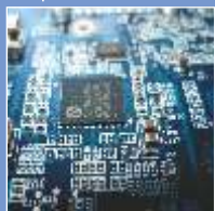
Электроника и Электрооборудование