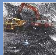
Coal & Mining