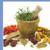
Аюрведическая и Травяная Продукция

Регистрация: r.karthik@cii.in | jitesh.modi@cii.in или посетите веб-сайт : www.theindiashow.in