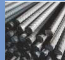
Iron & Steel