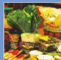
Procesed Food & Beverage