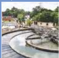
Управление Отходами и Водными Ресурсами