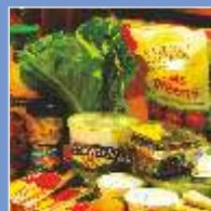
Обработанные Продукты Питания и Напитки