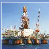
Нефть и Газ