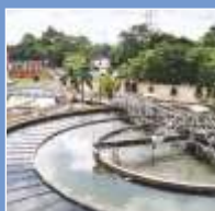
Water & Waste Management