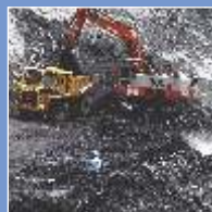
Угольная и Горнодобывающая Промышленность