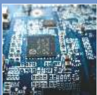
Electronics & Electrical Equipments